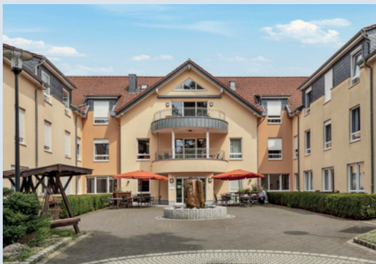
Altenpflegeeinrichtung „Haus Müller“ in Möhnesee/NRW