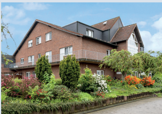
Altenpflegeeinrichtung „Haus Sebastian“ in Alpen-Veen/NRW