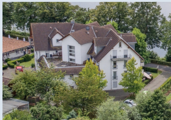
Anlage des betreuten Wohnens für Senioren „Haus Westfalenmeer“ in Möhnesee/NRW