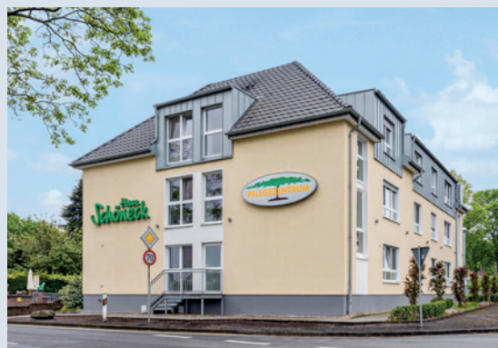
Altenpflegeeinrichtung „Haus Schöneck“ in Sonsbeck/NRW