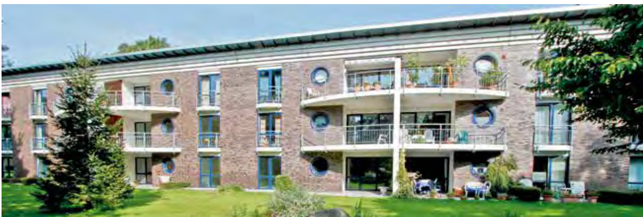
Beispiel einer Service-Wohnanlage, Abbestraße in Bremerhaven

Die IMMAC-Gruppe verfügt über ein tiefgreifendes Know-how in diesem speziellen Marktsegment und kennt die Bedürfnisse sowie Wünsche älterer Menschen.